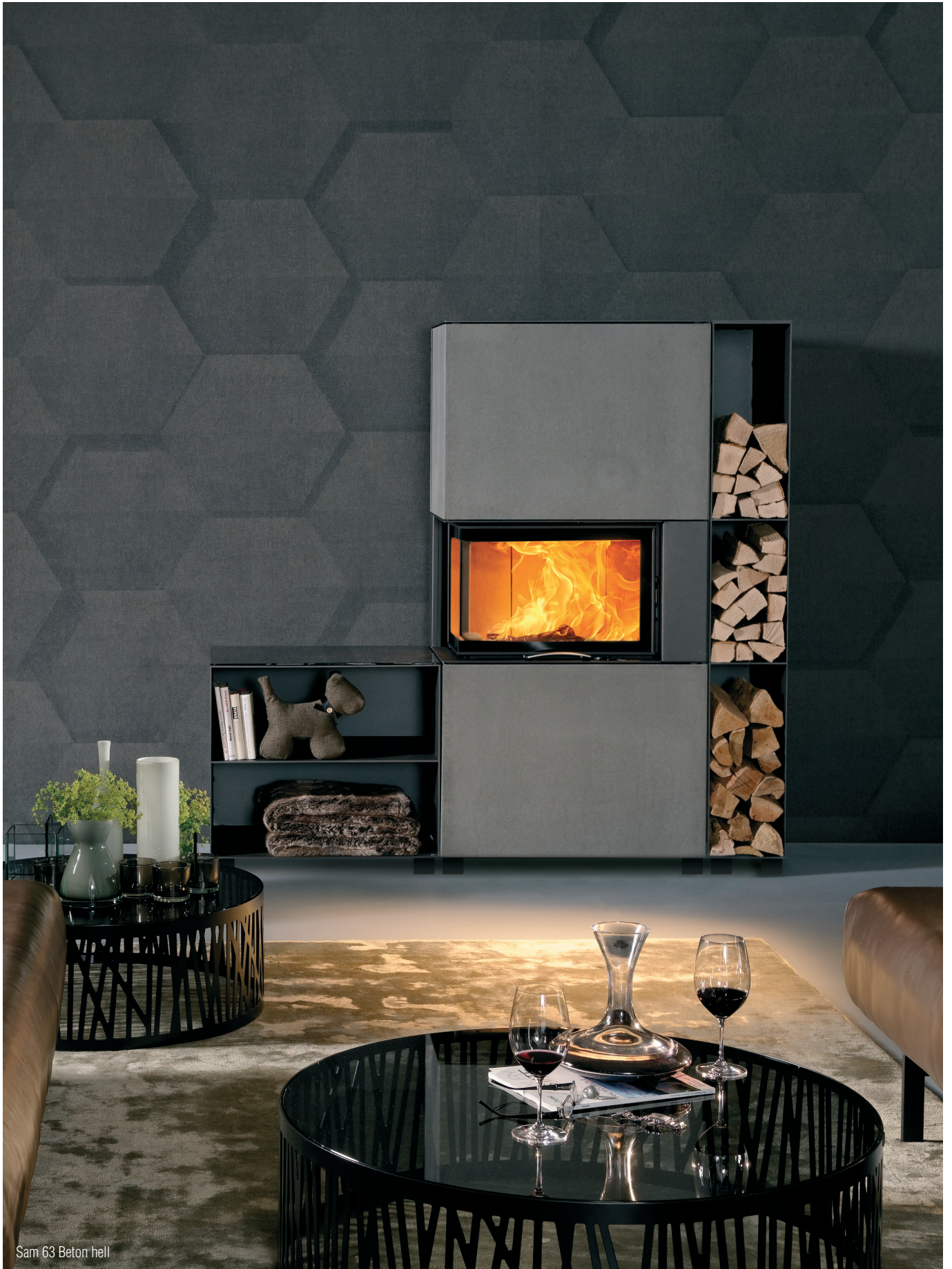
Sam 63 Beton hell