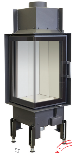
38x38x57K 2.0 - Art. no. 360147